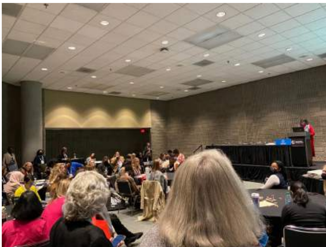
婦幼衛生會員大會